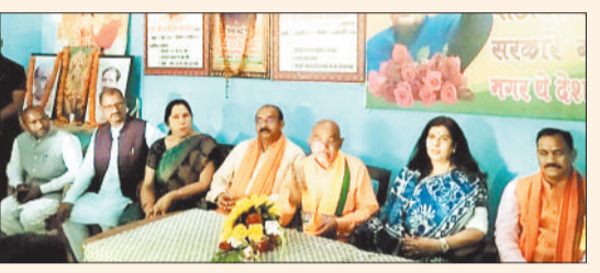
चिरमिरी में उपस्थित मंत्री व अन्य।

चिरमिरी पहुंचने पर भाजपा कार्यकर्ताओं ने किया स्वागत