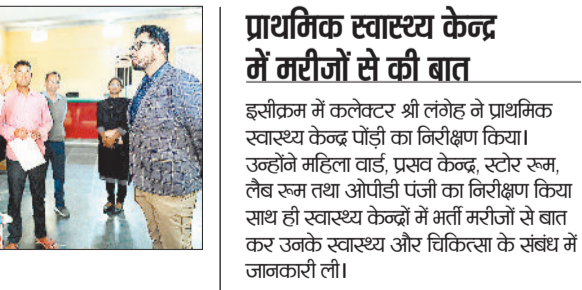
प्राथमिक स्वास्थ्य केन्द्र में मरीजों से की बात