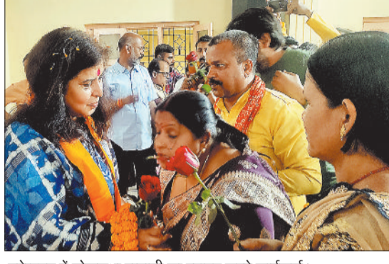
मनेन्द्रगढ़ में लोकसभा प्रत्याशी का स्वागत करते कार्यकर्ता।