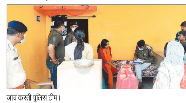
जांच करती पुलिस टीम।