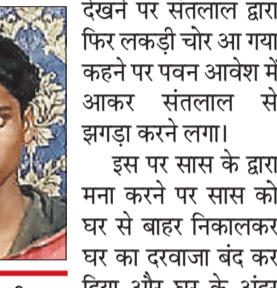
24 घंटे के भीतर अंधे कल्ल की गुथी सुलझी